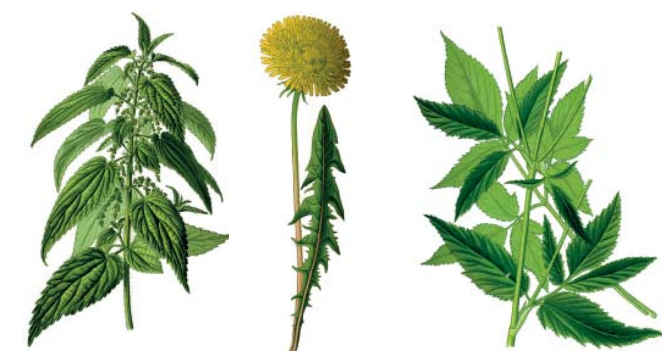
Schmackhafte Wildkräuter – zum Beispiel: Brennnessel · Löwenzahn · Giersch

Giersch war im Mittelalter bei den Mönchen sehr geschätzt. Als Gemüse und „Zipperleinskraut“ wurde er in Kloostergärten angebaut.